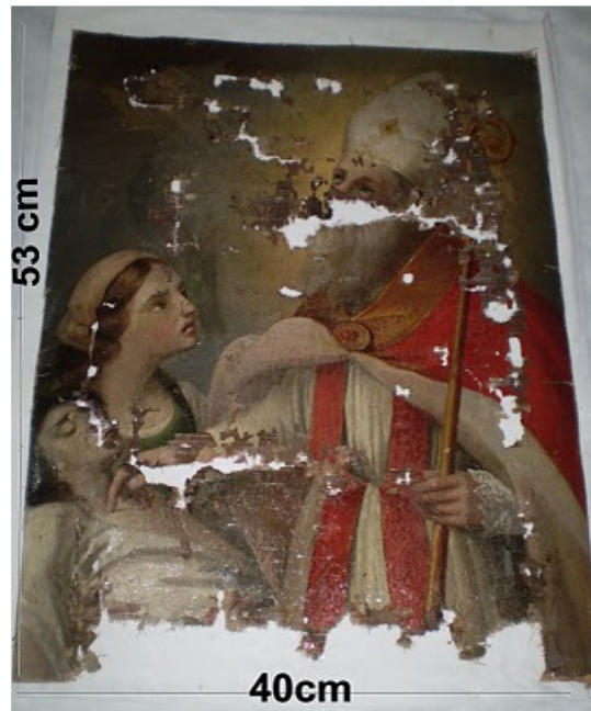
Quadro de San Valentin - Origem: Itália - Data 1879

O quadro sofreu um grande desgaste e encontra-se em precário estado de conservação.