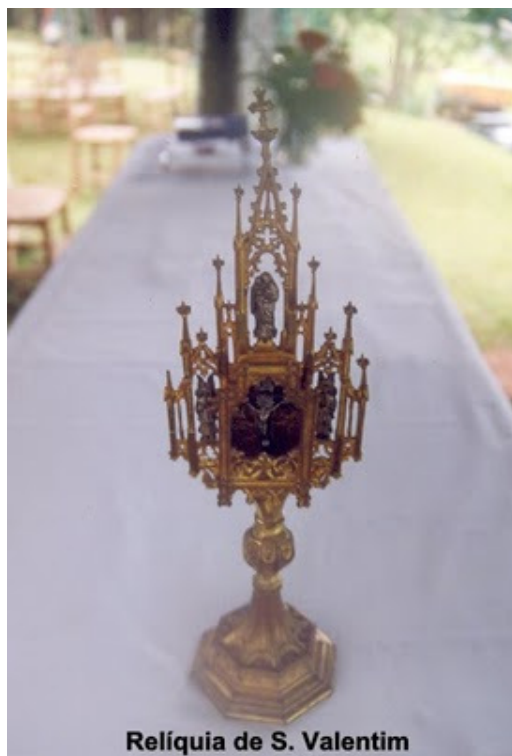
Relíquia de S. Valentin

A única Relíquia de San Valentin que existe no Brasil.