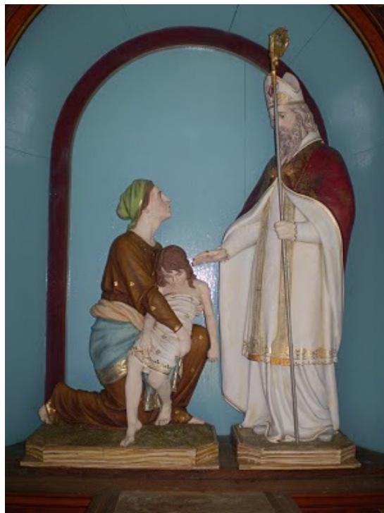
Escultura de San Valentin - Origem: Porto Alegre – RS - Data 1940