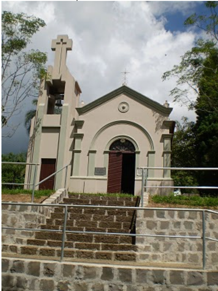
Capela de San Valentin