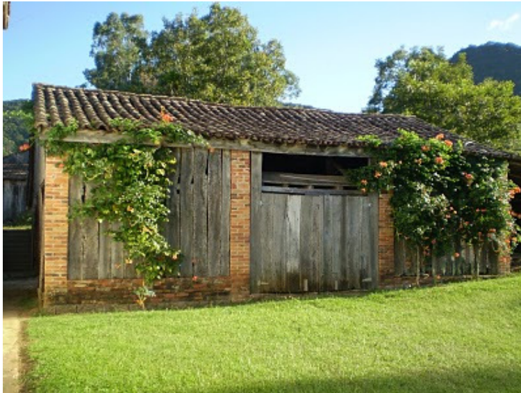
Galpão da casa de Archilino Venturini

O galpão servia para guardar comida para os animais, guardar os instrumentos de trabalho como a carreta entre outros. Normalmente no inverno os animais eram encerados no galpão para ser protegido das fortes geadas.