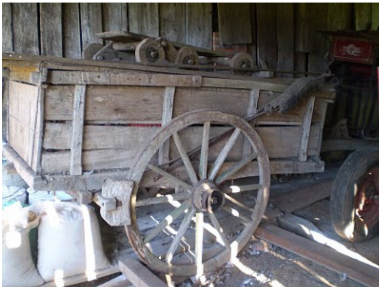
Carreta de boi